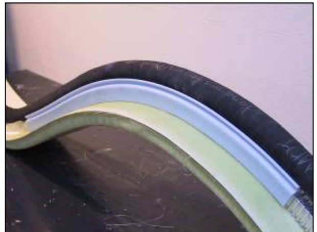
Profil und Laminat werden mit z.B. FlexLoad™ beschwert.