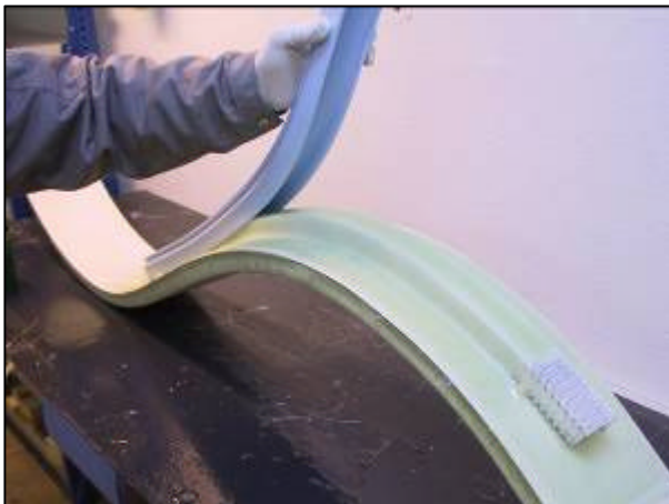
Das Profil wird auf dem losen Laminat plaziert