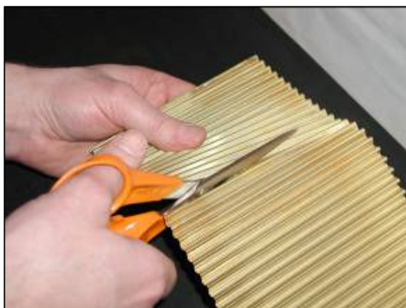
Den korrugerede folie kan klippes med en alm. kraftig saks !