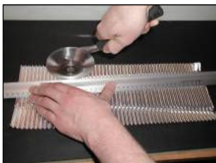
Bukkelinier laves med rulleværktøj

Materialerne kan forarbejdes med hænderne, med saks eller med simple rulleværktøjer.