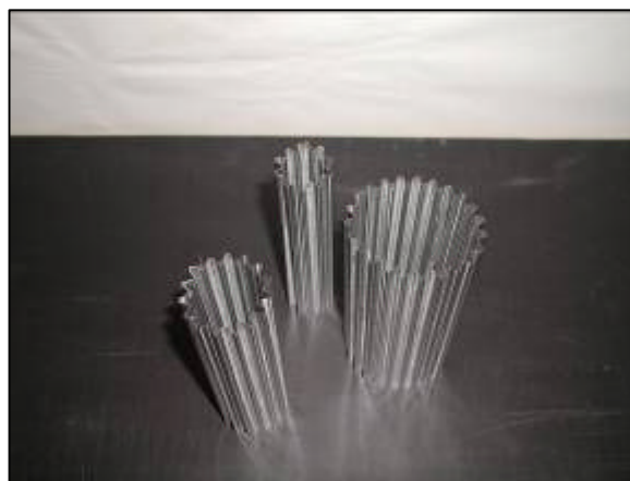
Her ses et eksempel på emner som er lavet i hånden og samlet med dobbeltklæbende tape.