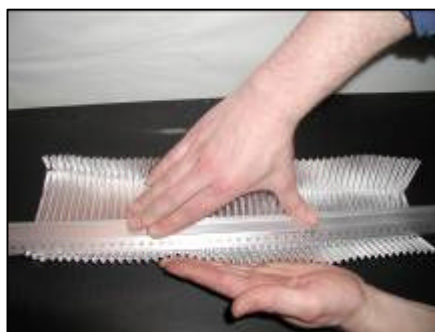
Kanter presses i facon