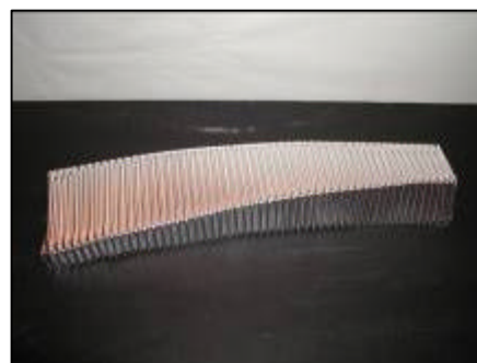
Resultatet er både stift og fleksibelt